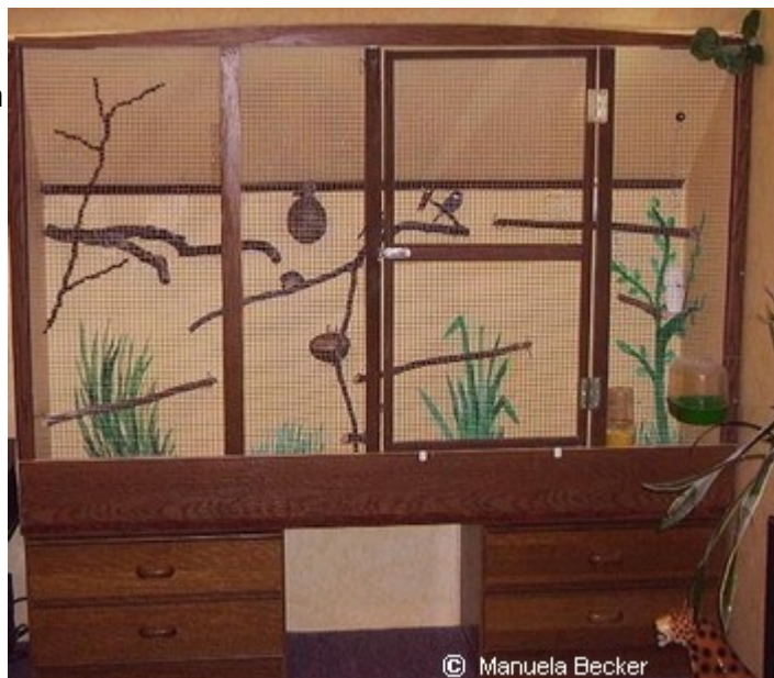
Zimmervoliere mit je einem Paar Zebrafinken und Reisfinken

Kanarienfutter ist für Zebrafinken zu fettreich und führt nachweislich zu Leberschäden.