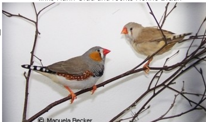
links Hahn Grau und rechts Henne Braun

Eine Schaukel kann für Abwechslung sorgen. Sehr beliebt und preisgünstig sind unbehandelte Sisalseile, die man quer durch den Käfig als Sitzmöglichkeit spannen kann. Sie laden die Vögel zusätzlich durch die grobe Struktur auch zum Zupfen der abstehenden Fasern ein und bieten somit Beschäftigung.