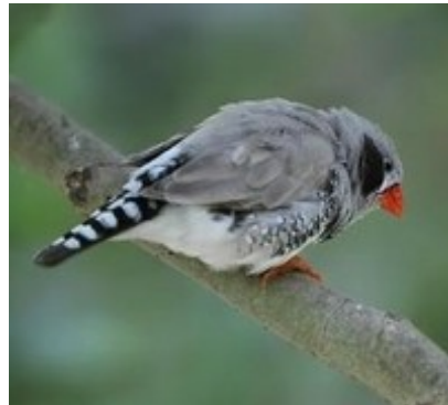
Schwarzwanne Grau (Hahn)