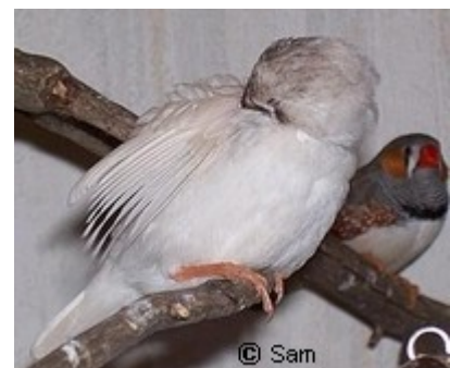
Jungvogel bei Gefiederpflege

Man sollte daher einen Blick auf den Schnabel werfen, der bei sehr jungen Zebrafinken schwarz und bei manchen hellen Farbschlägen hornfarben ist. Bei Tieren welche die Jugendmauser schon durchlaufen haben ist der Schnabel hingegen kräftig rot-orangefarben oder je nach Farbschlag gelblich. Die Augen wirken bei Jungvögeln sehr groß und rund, auch unterscheidet sich der Jungvogel noch etwas in der Größe vom Altvogel. Will man sicher gehen, kauft man seine Vögel bei einem Züchter, der einem das genaue Alter seiner Vögel benennen kann.